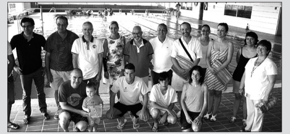
Edició de l'any passat.

REDACCIÓ. Valls serà, una vegada més, la seu central del Camp de Tarragona de la campanya «Mulla't per l'Esclerosi Múltiple 2014». En el marc d'aquesta activitat, la Fundació per l'Esclerosi Múltiple, en col·laboració amb l'Ajuntament de Valls i el Patronat d'Esports, organitza un sopar benèfic per recaptar fons per la mateixa Fundació. Al sopar, que es realitzarà el divendres, 4 de juliol, a les nou del vespre al Restaurant Masia Bou, hi assistiran representants de les entitats esportives de Valls, així com representants de les institucions locals, del món empresarial i associatiu de la ciutat.