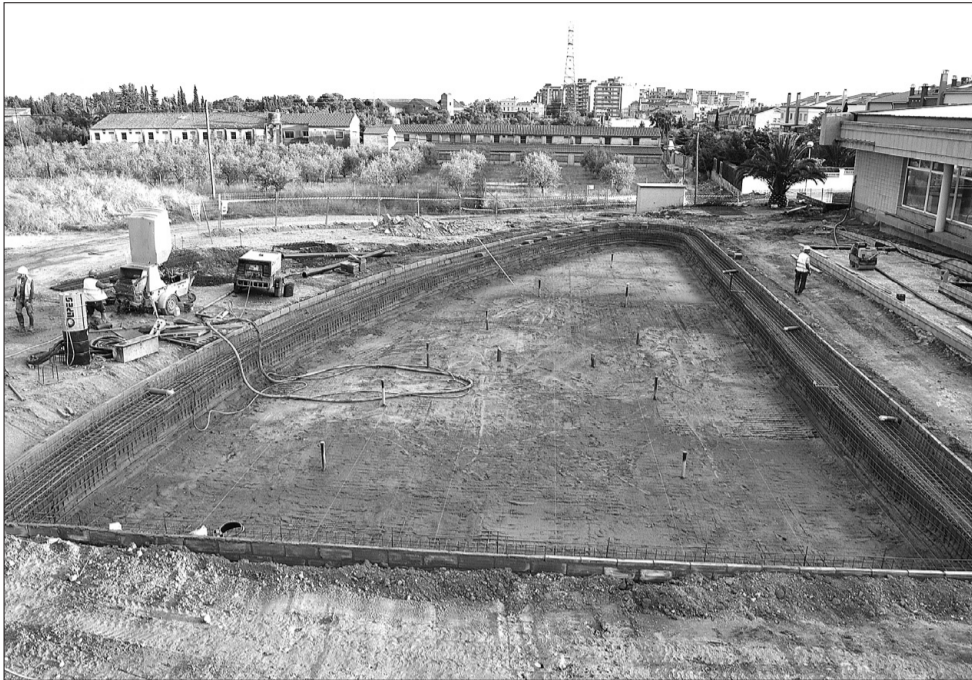
Un dels murs de la piscina que va fer caure el fort aiguat de dimarts.