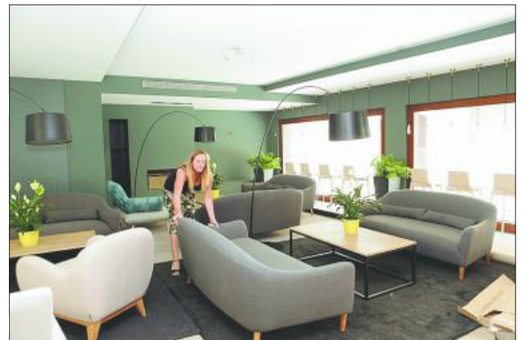
El Hotel Raval de la Mar abre hoy sus puertas. Dispone de tres plantas, 36 habitaciones y parking opcional.

Sus clientes podrán acceder a los servicios de Group Palas en La Pineda (Spalas, Gran Palas Hotel y Hotel Palas Pineda) con tarifas preferenciales. — J. DÍAZ