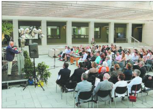
Un momento de la cita, donde el centro hizo un reconocimiento a todos los que apoyan su actividad.